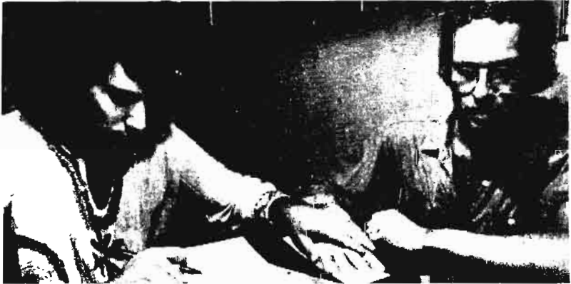
- هذه صور للساحر كراولى فى مراحل مختلفة من عمره .. وفى أماكن متعددة من العالم : فى بريطانيا وفى مصر وفى الهند

وبقيت المشكلة حية متعشة كما هي : ما هذا الذى فى داخل بعض الناس ، ولا بد أنه فى داخل كل الناس ، ولكننا لا نعرف ومن الواجب أن نعرف ..